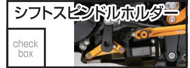
ベビーフェイス シフトスピンドルホルダー 8,250 円