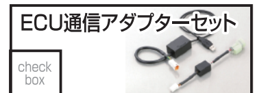
キタコ ECU 通信アダプターセット 18,700 円