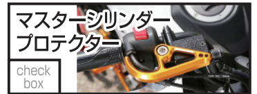
ベビーフェイス マスターシリンダープロテクター 8,800 円