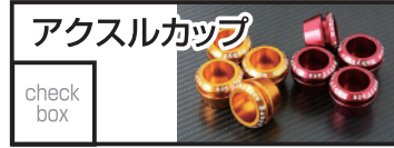
ベビーフェイス アクスルカップ 4,290 円