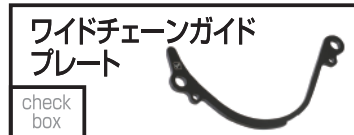
キタコ ワイドチェーンガイドプレート 1,540 円