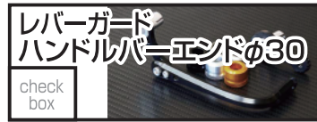
ベビーフェイス レバーガード+ハンドルバーエンド 13,200 円