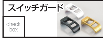
キタコ アルミスイッチガード 1,650 円