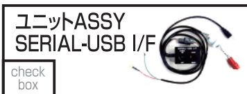
HRC 38880-N1C-770 36,080 円