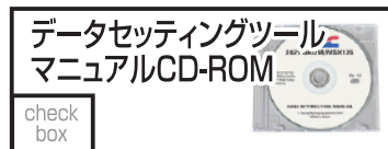
HRC 38773-K26-R20 2,200 円