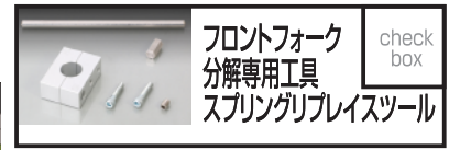
キタコ フロントフォーク分解専用工具 スプリングリプレースツール 7,700 円