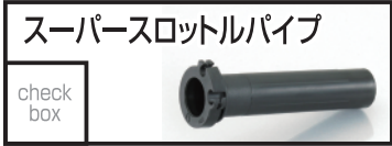
キタコ スーパースロットルパイプ 660 円