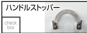
K-FACTORY ハンドルストッパー 5,500 円