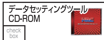
HRC 38772-NX7-040 3,850 円