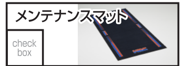
HRC メンテナンスマット 22,000 円