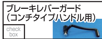
バトルファクトリー ブレーキレバーガード (コンチタイプハンドル用) 12,500 円