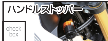
ベビーフェイス ハンドルストッパー 10,780 円