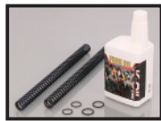
KITACO フロントフォークインナーコイル& フォークオイルSET 7,700 円