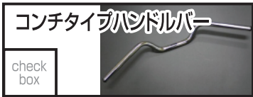
T-TECH コンチタイプハンドルバー 6,600 円